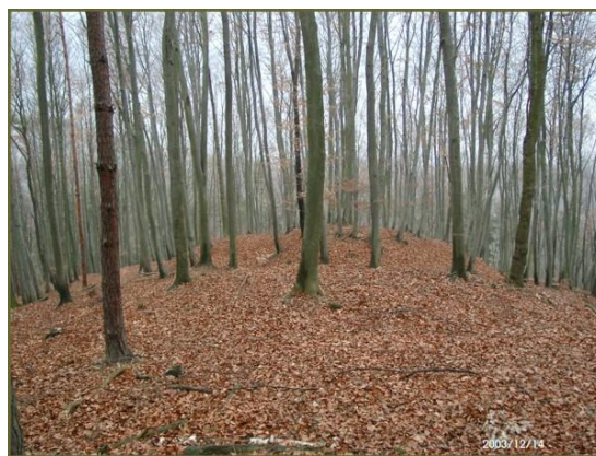
Az Árpád-kori „kisvár” helye