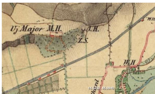
A második katonai felmérés térképén a J.H. felirat jelöli a vadászház helyét, ami a Kövecses-domb keleti szélén volt. Eredeti a jelölés, ugyanis kinagyítva egy agancs is látható

Bár nem közvetlenül ide tartozik, de itt írom le azt, hogy a Batthyányiak nem véletlenül építettek fel