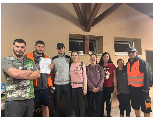
III. Helyezett: Exactly