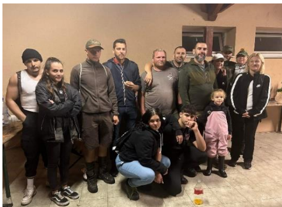
I. helyezett csapat: TEKergők meg a Sanyi

Negyedik alkalommal, 2023. július 22-én került megszervezésre a csákydoroszlói Bagolytúra. 15 csapat vágott neki a 7,5 km-es távnak. A délutáni kedvezőtlen időjárás nem tántorította vissza az éjszakai túrázókat, akiknek 7 állomáson keresztül kellett ügyességi versenyeken megfelelni. A belépő feladat egy csapatbemutató videó készítése volt; zenefelismerés, lengőteke, növényi magok elsajátítása és még számtalan ügyességi játékban kellett megmérkőzniük az indulóknak. Az éjszaka folyamán volt, aki eltévedt, megfáradt, végül mindeki célba ért, feladatait teljesítve hajnal hasadtáig.