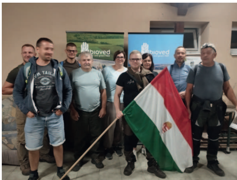
A Bagolytúra 3. helyezett, különdíjas csapata