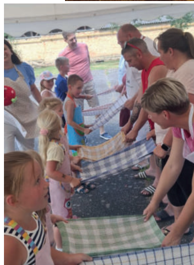
További fotók a 7. oldalon